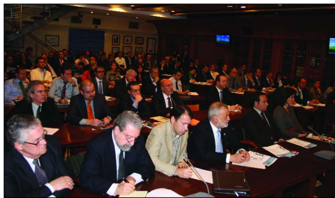
Aspecto parcial del público asistente.