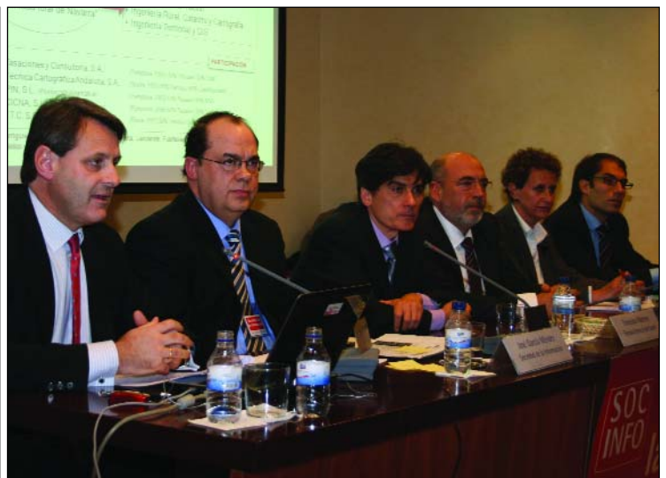
Vista general de la primera (izquierda) y segunda mesa de ponentes.