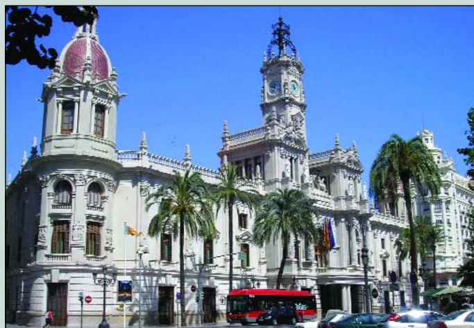
Fachada del Ayuntamiento de Valencia.

“Dado el éxito y la seguridad que nos da esta tecnología, la idea es seguir virtualizando más servicios”.