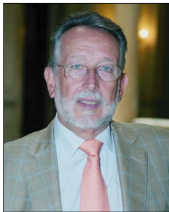
Alfonso Grau (Ayuntamiento de Valencia).

1. Se trata de una revolución en cuanto a la relación con nuestros ciudadanos y ciudadanas. Con la e-administración, se eliminan las barreras del espacio y del tiempo.