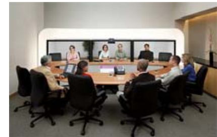
EJ. SALA TELEPRESENCIA.