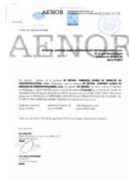
AENOR SI-0002/05 ISO 27001