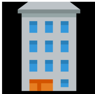
Conselleria de Sanidad Universal y Salud Pública