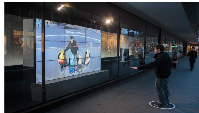
Sistema de realidad virtual y aumentada